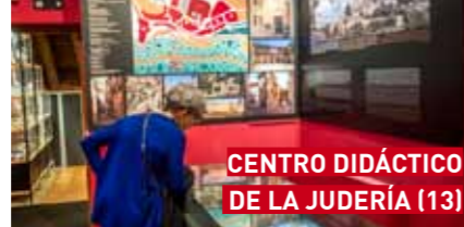
CENTRO DIDÁCTICO DE LA JUDERÍA (13)

CENTRO DIDÁCTICO DE LA JUDERÍA C/ Judería VAieja, 12 Tel. 921 46 23 96 juderia.turismodesegovia.com juderia@turismodesegovia.com