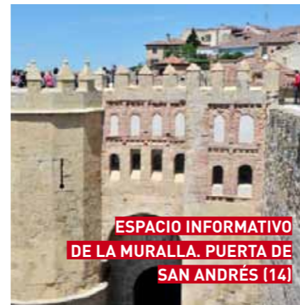
ESPACIO INFORMATIVO DE LA MURALLA. PUERTA DE SAN ANDRÉS (14)