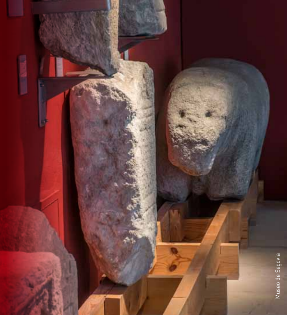
Museo de Segovia

Ante eventuales cambios en los horarios y tarifas se recomienda confirmarlos en las webs de cada centro.