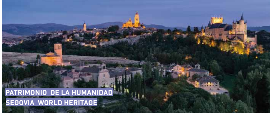
PATRIMONIO DE LA HUMANIDAD SEGOVIA WORLD HERITAGE