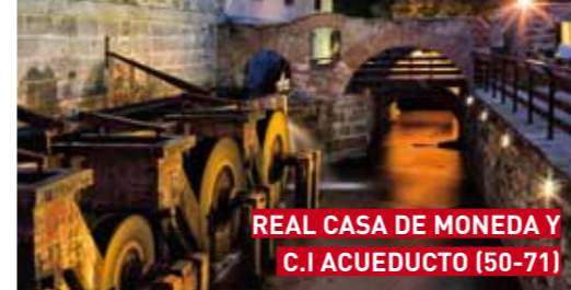
REAL CASA DE MONEDA Y C.I. ACUEDUCTO (50-71)

REAL CASA DE MONEDA Y CENTRO DE INTERPRETACIÓN DEL ACUEDUCTO C/ de la Moneda s/n. Tel. 921 47 51 09 www.casamonedasegovia.es casademoneda@turismodesegovia.com