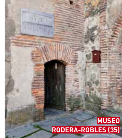
MUSEO RODERA-ROBLES (35)

MUSEO RODERA-ROBLES C/ San Agustín, 12 Tel. 921 46 02 07 www.roderarobles.com infomuseo@rodera-robles.org