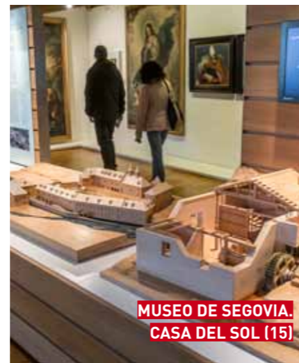
MUSEO DE SEGOVIA. CASA DEL SOL (15)