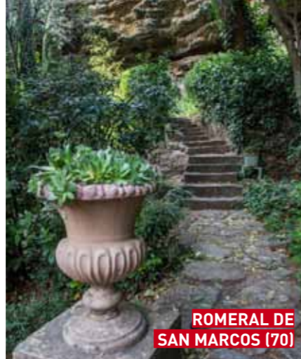
ROMERAL DE SAN MARCOS (70)

ROMERAL DE SAN MARCOS C/ Marqués de Villena, 17 Tel. 921 46 10 77 / 655 13 14 46 Horario: Previa reserva telefónica. Tarifa: Entrada única 3 €