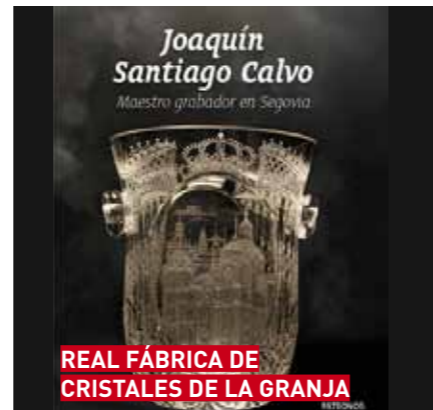
REAL FÁBRICA DE CRISTALES DE LA GRANJA

Horario marzo: De martes a viernes de 10.00 a 15.00 h Sábados de 10.00 a 18.00 h Domingos y festivos de 10.00 a 15.00 h Horario abril: De martes a sábado de 10.00 a 18.00 h Domingos y festivos de 10.00 a 15.00 h Tarifas: • General 6 € • Reducida 5 € (Consultar otras condiciones) • Mínima 3 € (Consultar otras condiciones) • Gratuita miércoles de 15.00 a 18.00 h y menores de 10 años.