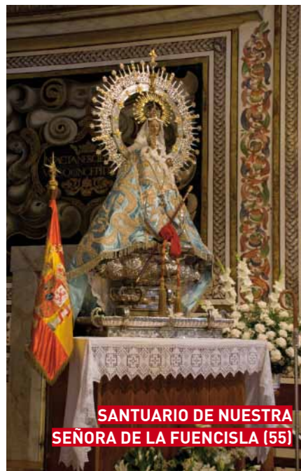
SANTUARIO DE NUESTRA SEÑORA DE LA FUENCISLA (55)