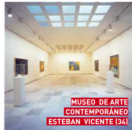
MUSEO DE ARTE CONTEMPORÁNEO ESTEBAN VICENTE (34)