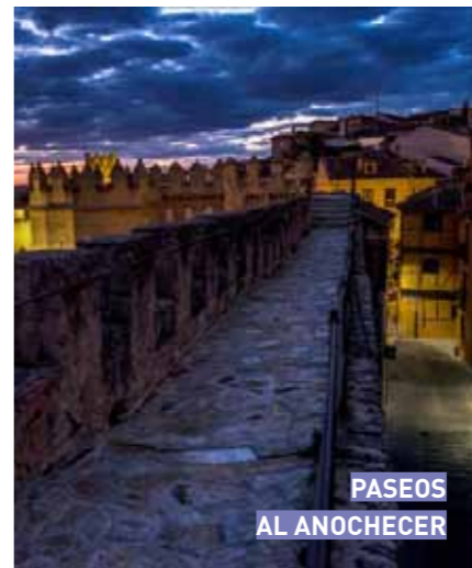
PASEOS AL ANOCHECER