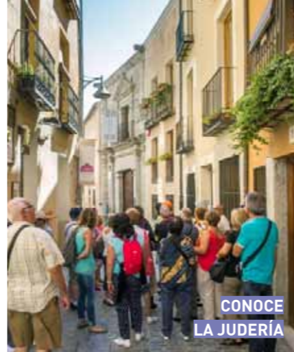
CONOCE LA JUDERÍA