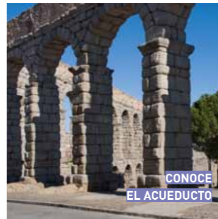
CONOCE EL ACUEDUCTO