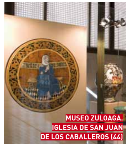
MUSEO ZULOAGA. IGLESIA DE SAN JUAN DE LOS CABALLEROS (44)

MUSEO ZULOAGA. IGLESIA DE SAN JUAN DE LOS CABALLEROS Plaza de Colmenares, 4 Tel. 921 46 33 48 www.museoscastillayelon.jcyl.es museo.segovia@jcy.es