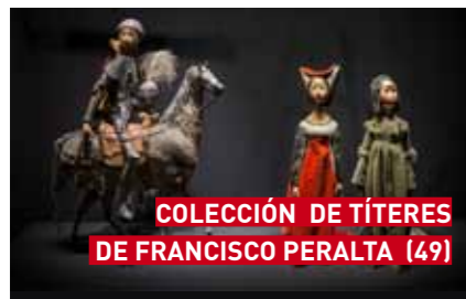
COLECCIÓN DE TÍTERES DE FRANCISCO PERALTA (49)