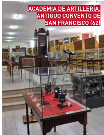
ACADEMIA DE ARTILLERÍA. ANTIGUO CONVENTO DE SAN FRANCISCO (62)

Horario: Visita siempre con guía acreditado. Martes, jueves y sábado a las 11.00 h Precisa solicitud previa a través de jgonlaa@et.mde.es o ocacart@et.mde.es Tarifa: Entrada gratuita.