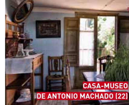
CASA-MUSEO DE ANTONIO MACHADO (22)