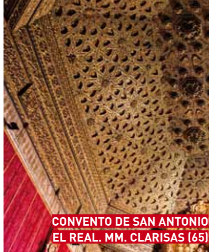
CONVENTO DE SAN ANTONIO EL REAL. MM. CLARISAS (65)

CONVENTO DE SAN ANTONIO EL REAL. MM. CLARISAS C/ San Antonio El Real, 6 Tel. 921 42 20 28 / 622 48 43 00