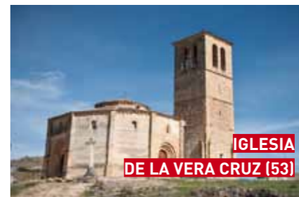
IGLESIA DE LA VERA CRUZ (53)