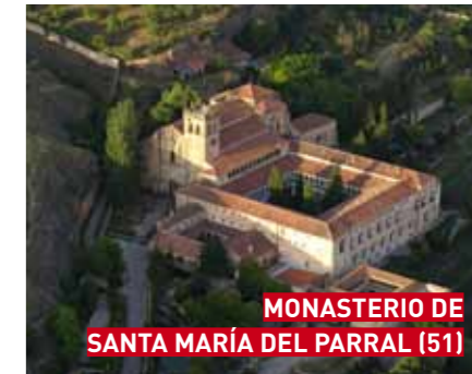
MONASTERIO DE SANTA MARÍA DEL PARRAL (51)

MONASTERIO DE SANTA MARÍA DEL PARRAL C/ Parral, 2 Tel. 921 43 12 98